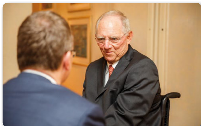
Prof. Dr. Lars P. Feld und Dr. Wolfgang Schäuble

Die hier genannten öffentlichen Äußerungen sind vor allem Ihre. Sie sind mit sechs Reden, Interviews und Namensbeiträgen im Literaturverzeichnis zitiert; Bundeskanzlerin Merkel mit einer Regierungserklärung aus dem Jahr 2012.