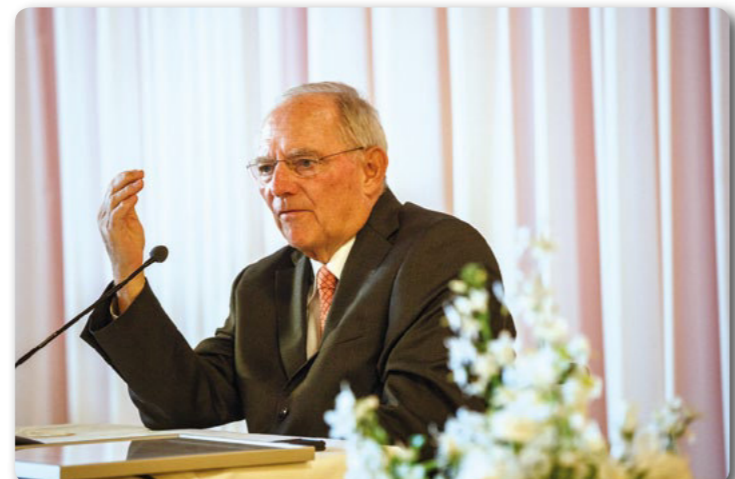
Bundesfinanzminister Dr. Wolfgang Schäuble verband seine Dankesworte mit interessanten Einblicken in aktuelle finanzpolitische Fragen.

Bei Lichte betrachtet macht sich die EU, wahlweise Deutschland, als Sündenbock so gut für Politiker in den Mitgliedstaaten, weil es bereits eine Verzerrung in den Verantwortlichkeiten gibt. Der Stabilitäts- und Wachstumspakt suggeriert, dass die fiskalpolitischen Entscheidungen auf EU-Ebene getroffen werden, wenn doch die Mitgliedstaaten ihre Haushaltsautonomie eifersüchtig verteidigen. Die Kommission suggeriert in allen möglichen Politikbereichen, dass sie Kompetenzen besitzt, selbst dort, wo der Lissabon-Vertrag dies nicht vorsieht. Mehr von dieser Medizin, welche den ersten Desintegrationsschritt in Europa seit dem Zweiten Weltkrieg mitbewirkt hat, wird kaum als Gegenmittel taugen. Mehr Integration ist nur noch mit strikter Respektierung des Haftungsprinzips in seiner weiten Interpretation möglich.