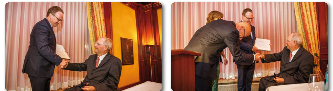
Die Walter-Eucken-Medaille wird von Vorstand und Kuratorium des Instituts und dem Aktionskreis Freiburger Schule verliehen.

Die EU wird für den wirtschaftlichen Misserfolg verantwortlich gemacht. Die EU, wahlweise auch Deutschland, müssen als Sündenböcke herhalten, weil die politisch Verantwortlichen in den Mitgliedstaaten es sich einfach