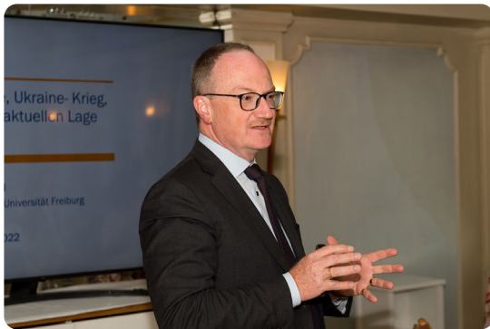
Krisenzeit – Ihre Fragen an Lars Feld