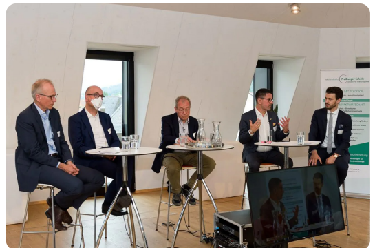
Podiumsdiskussion zum Thema "Green Deal"