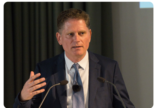
Prof. Markus Brunnermeier, Ph.D.